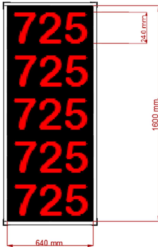
Fig. 3 – simulacion de letrero en funcionamiento.