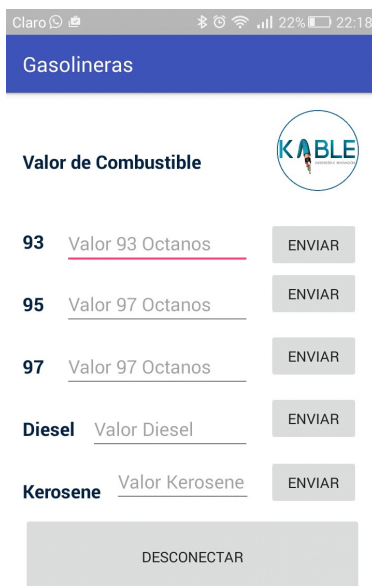
Fig. 4 – Interfaz principal aplicación.

La comunicación con los letreros se realiza mediante una aplicación para dispositivos con S.O. Android, que mediante comunicación Bluetooth envía los valores para cada combustible. Dicha aplicación es de código propio y su interfaz principal se puede apreciar en la siguiente figura.